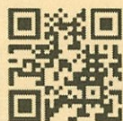
神奈川県聴覚障害児 支援中核 HP

大切なお子さんのきこえについて心配を抱えるご家族、支援者の皆様が必要な情報を知り、地域のサポート機関とつながることを目的とした事業です それぞれの詳細は、左下の QR コードからご確認ください