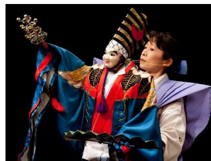
ひとみ座 乙女文楽

手話CGによる案内サービス「手話コンシェルジュ」 補聴援助機器 Auracast、ONTELOPE グラス (音の視覚化) ハンズフリーで会話を可視化 (AiLENS) Sound Display・D-HELO (音の見える化アプリ) Cotopat (字幕表示システム)、SureTalk(手話認識アプリ)、 電話リレーサービス、ヨメテル、各種デモンストレーション アクティブ交番 (藤沢警察署)