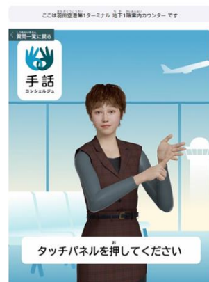
手話コンシェルジュ