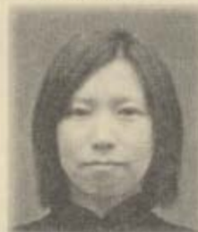
中都弥生 (海老名市)