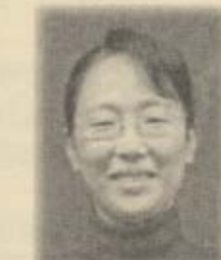
ケブラー小百合 (伊勢原市)